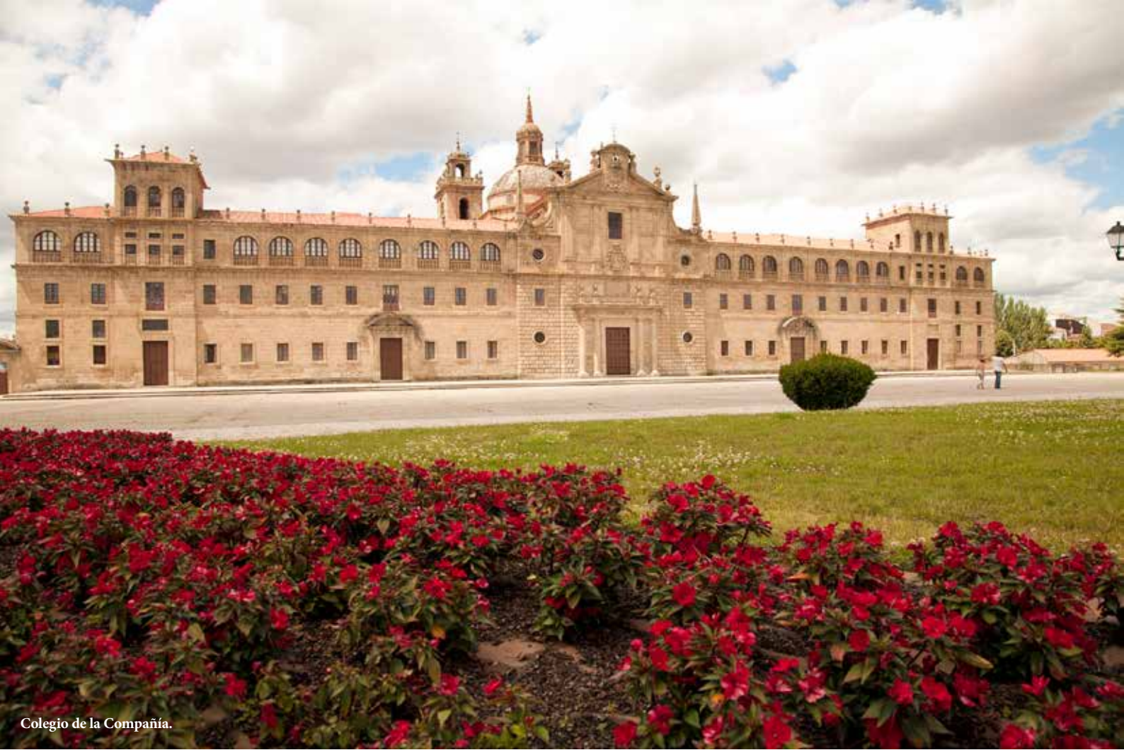
Colegio de la Compañía.